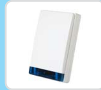
Trådløs, ekstern sirene